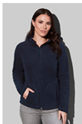
ST5100 Fleece Jacket